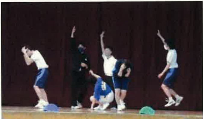
▲生徒会活動 「新入生歓迎会」より

にも表情を感じることができま す。実に頼もしい生徒たちです。 生徒にも職員にも「明日が待ち 遠しいわくわくする中部中」とな るよう、引き続き保護者・地域の 皆様のご支援をお願いいたします。