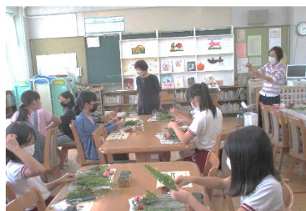
フラワーアレンジメントクラブ