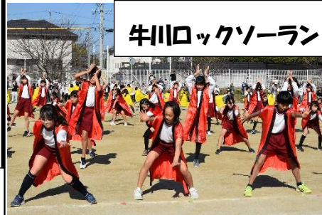
牛川ロックソーラン