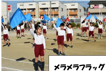
メラメラフラッグ