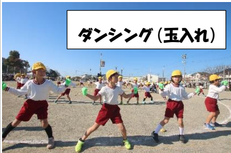
ダンシング(玉入れ)