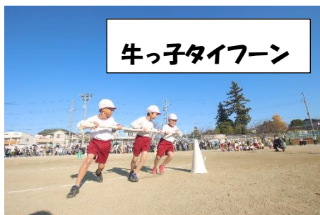
牛っ子タイフーン