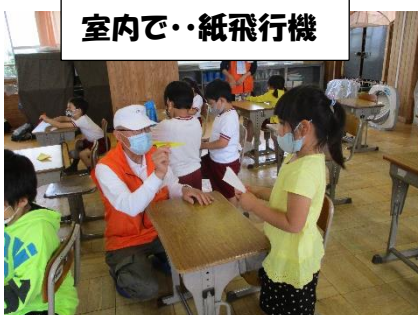
室内で・・・紙飛行機