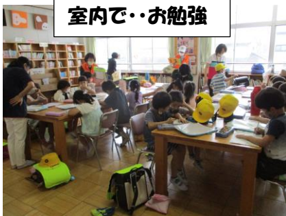
室内で・・・お勉強