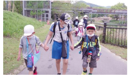
【みんなで仲良く、楽しく】

パーク内では、たてわり班ごとにウォークラリーを行い、みんなで楽しむことができました。事前の準備では、6年生が園内のルートを考えたり、1年生へのプレゼントを作成したりするなど、学校のリーダーとして大活躍でした。