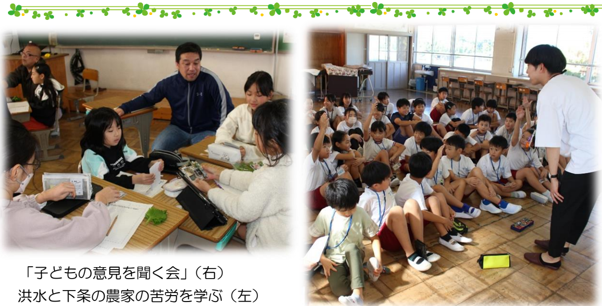
「子どもの意見を聞く会」(右) 洪水と下条の農家の苦労を学ぶ(左)

今年も、全学年で「下条大好き」を大きなテーマに掲げ、地域に根ざした学習に力を入れて取り組みました。 市の子どもの意見を聞く会では、「下条は人が温かい」「緑豊かなところが好き」など、下条のよさをしっかりとらえている子が多く、うれしく思いました。一方、「交通が不便」「商業施設がほしい」などの意見も出ました。その後、未来の下条を本気で考え、調べ、話し合いました。 学校の屋上を有効活用して牧場をつくらうと考えたグループは、調べたり地域のひとにアドバイスをもらったりするうちに、現実的ではないことがわかりました。そこで、みんなが集える憩いの場を作ったり、下条を考える会と協働したりして、地域を盛り上げようと考えました。また、下条の特産を広げるために、豊橋の名産品とのコラボを考え出したり、洪水から下条の町や特産品を守