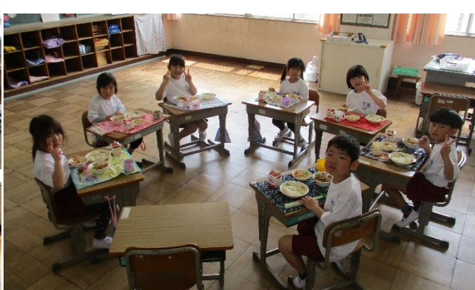
はじめての給食の味は最高だったね