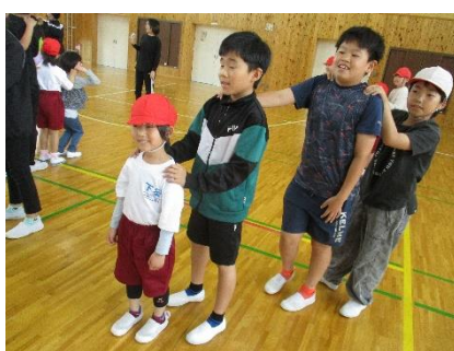
下条っ子じゃんけん列車楽しかったね