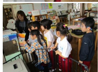
下条小学校の図書室は本がいっぱいだね。たくさん本を読もう！