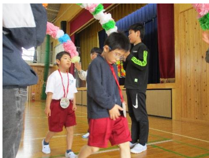
1年生を迎える会でメダルをもらったよ