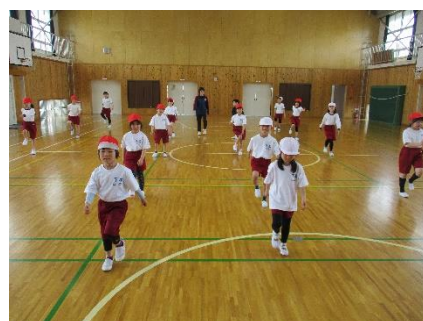
2年生にチャレンジ体操を教えてもらったよ