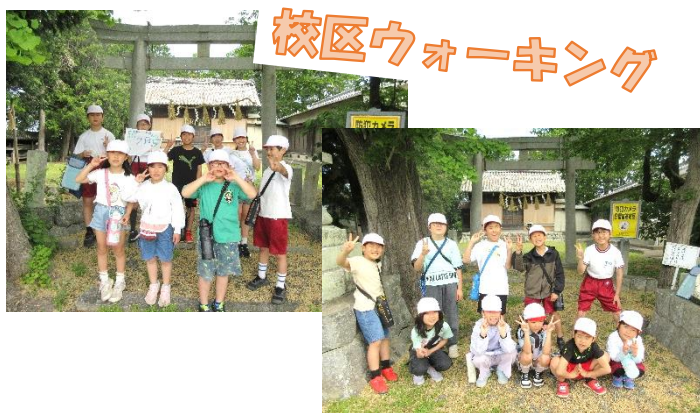
校区ウォーキング

校区ウォーキングでは、高学年として6年生の班長のサポートをがんばりました。低学年に優しく声をかけたり、列を整えたりと、班員みんなのために率先して動く姿が見られました。今年度初めてのえみなご班での活動。新しいメンバーとの仲を深めるよいきっかけとなりました。笑顔いっぱい、思い出いっぱい、大成功の校区ウォーキングとなりました。