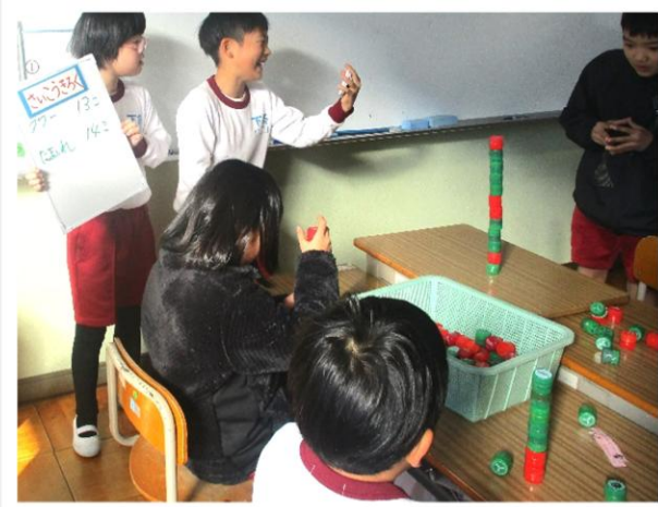
「2年生活科 おもちゃまつり」(右) 「みのりクリスマスワールド」(左)