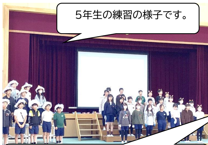
5年生の練習の様子です。

学習発表会本番に向けて、子どもたちは一生懸命、練習に取り組んでいます。「保護者の方や地域の方にわかりやすく伝えるためにはどうすればよいか？」それぞれの学年で工夫をしています。当日の子どもたちのがんばりにご期待ください。