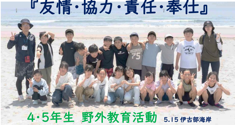
4・5年生 野外教育活動 5.15 伊古部海岸