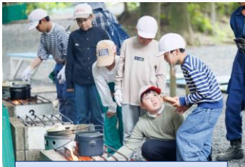
仲間っていいなあ。