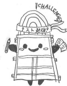
タイトル テスト勉強 どうたん