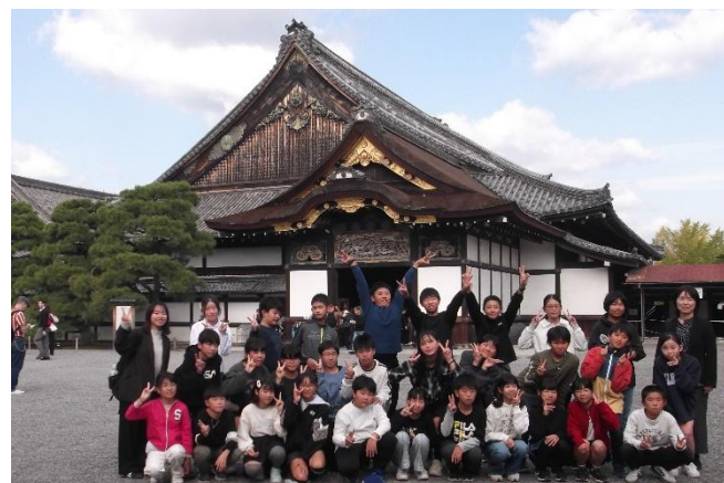
【 二条城 (3組集合写真) 】

旅館での食事は、各部屋で食べました。友達と一緒に食べる食事は格別においしく、楽しいひとときでした。