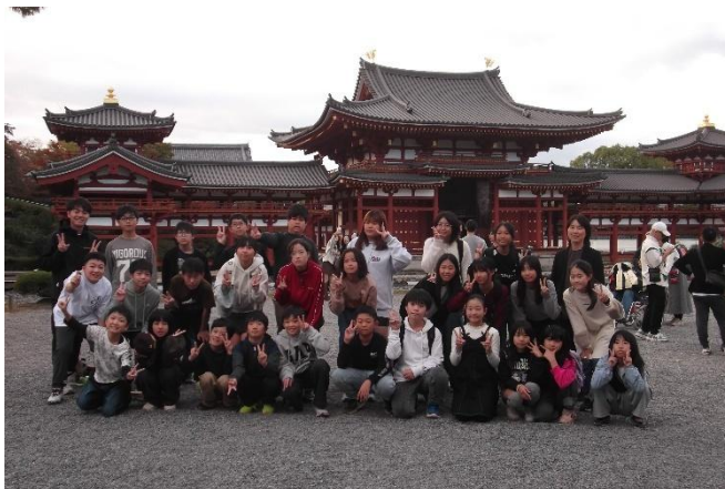
【 平等院 (1組集合写真) 】

奈良公園若草山の前で鹿とたわむれました。鹿せんべいをあげたいのに、怖くて逃げ回っている子もいました。