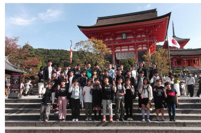
【 清水寺 (2組集合写真) 】

北野天満宮に参拝しました。学問の神様のご利益にあやかりたいと、お守りを購入したりおみくじをひいたりしました。