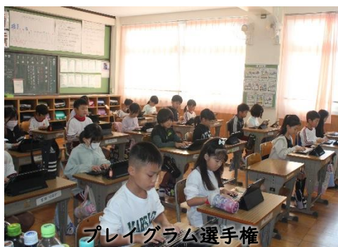
プレイグラム選手権