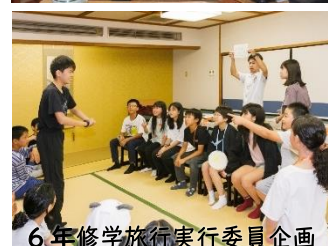
6年修学旅行実行委員企画