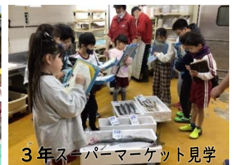
3年スーパーマーケット見学