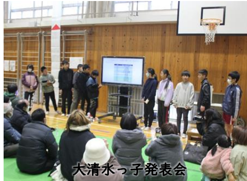
大清水っ子発表会