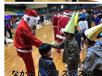
なかよしクリスマス会