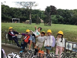
2年のんぱいパーク見学