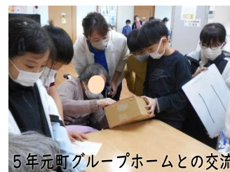
5年元町グループホームとの交流