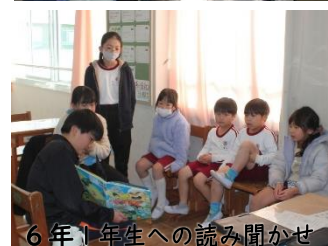
6年1年生への読み聞かせ