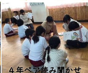
4年ペア読み聞かせ