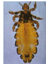
アタマジラミの成虫