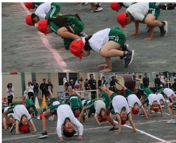
【すぎやまスポーツフェスティバル(5.24)】