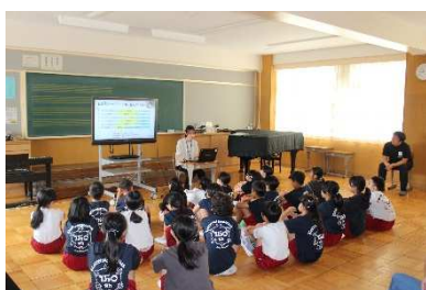
5年生は対面で学校保健委員会に参加

10月下旬に修学 旅行を控えた6年生 は、旅行業者も交え て事前説明会を行 いました。