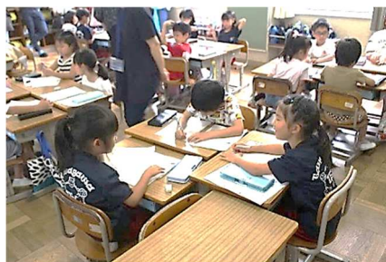
1年生活科 お手伝いについての話し合い

おうちのかたが教室 にいて、子どもたちは、 何だか緊張気味でした。 ICT機器を活用した り、小グループで話し合 いをしたりと各学年で 工夫した学びを取り入 れていました。