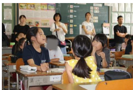
2年学活 食育の授業

学校保健委員会は心 身の健康を高めるため に、メディア機器の利用 時間と生活習慣の改善