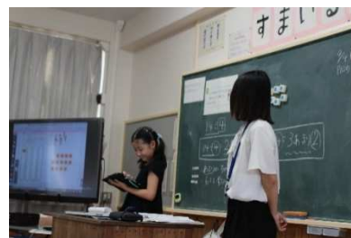
3年算数 タブレット端末で余りのあるわり算