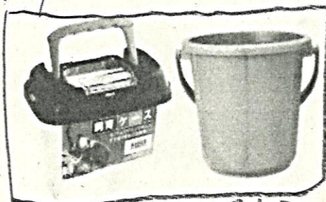
⑦ 生きものを入れるもの Recipiente ou material p/colocar os peixinhos e bichinhos.