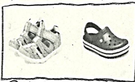
④ かかとのあるサンダル Sandália que segure no calcanhar