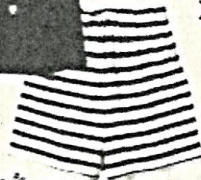
③ 着替え Troca de roupa