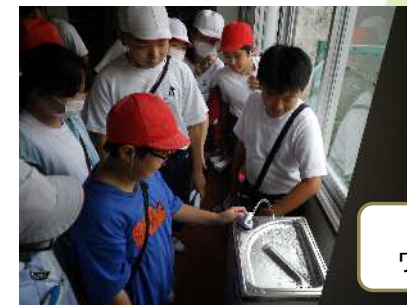
PTAより ウォータークーラーの寄附