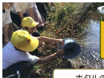
ホタルの飼育活動