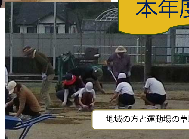
地域の方と運動場の草取り