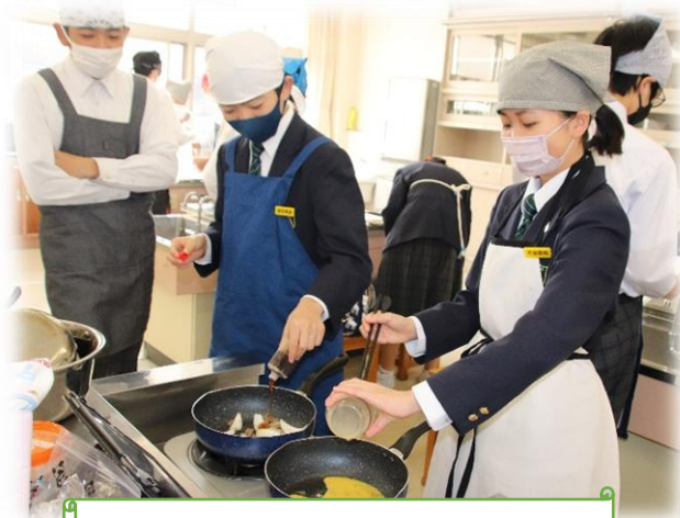
『調理実習の様子(1月19日)』